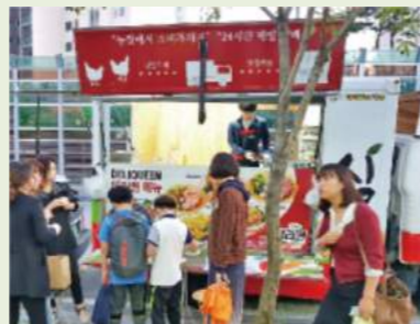
| 오송생명과학점 시식행사 |