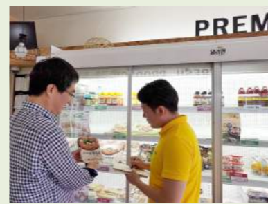
| 화성향남점 가맹점주 재교육 |